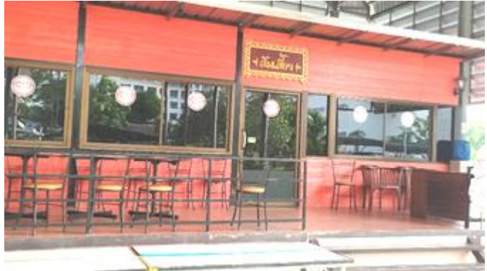
การจัดทำป้ายไว้นิลประชาสัมพันธ์ ตาก 1 เขตสุจริต